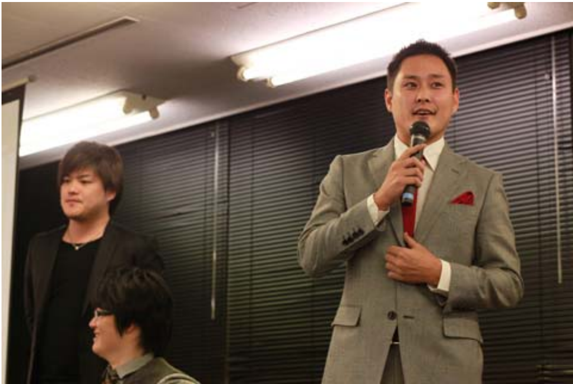
吉田さん締めという言葉の図。