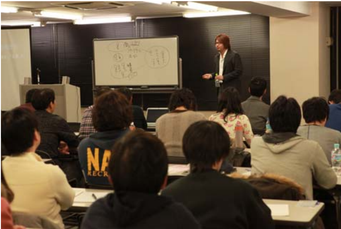
木坂氏講義するの図。