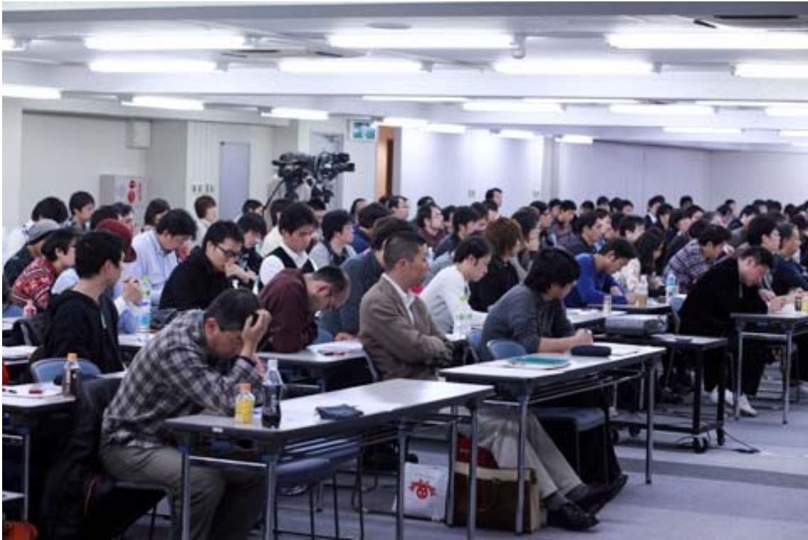
講師側から見るとこんな感じ。すごい密度・・・！