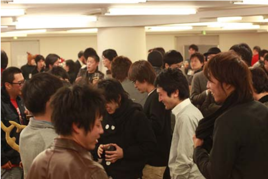
わらわらわらわら。若者たちが、なにやら悪巧みをしておる様子！危険！危険！笑