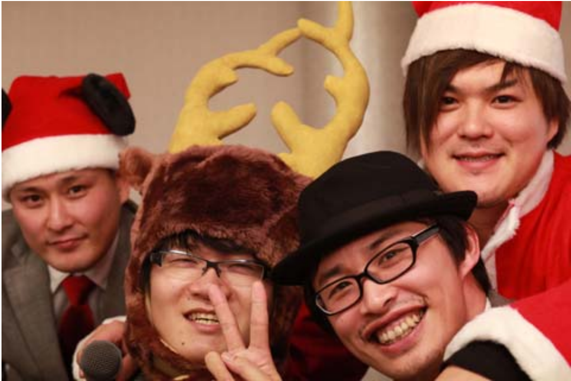
一等賞の「創造的破壊 iPad」を手に入れた方と記念撮影。パシヤリ！